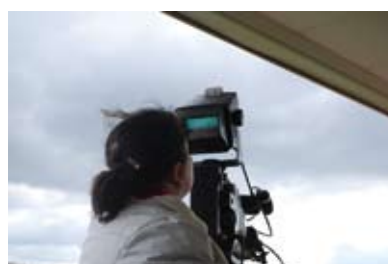
16. Au 3 ème étage, on filme les courses