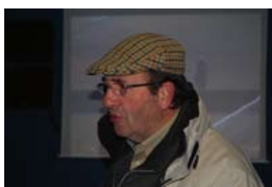
19. Le débriefing par le Président, avec tous, dans la salle des commissaires