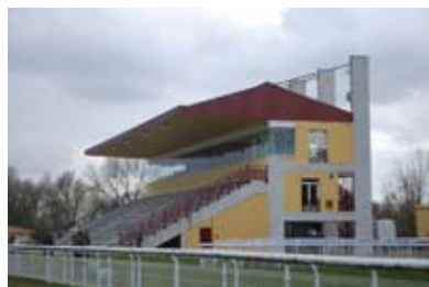
1. La nouvelle tribune