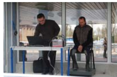
3. La balance essayée par un jockey