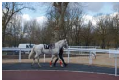
8. Juste avant la mise en selle