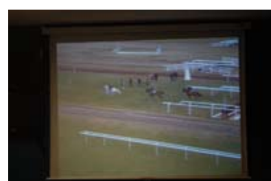
18. Le film repasse dans la salle des commissaires