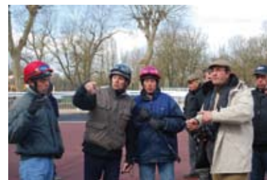
6. Le Président donne ses derniers ordres