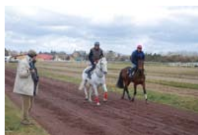
11. Les chevaux reviennent du parcours des haies