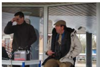
4. La balance essayée par le Président