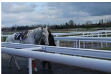
7. Les chevaux tournent au Rond de Présentation