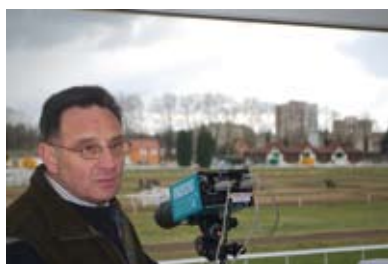
13. Au 1 er étage de la tour, la photo finish