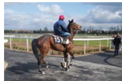
9. Les jockeys se rendent au départ