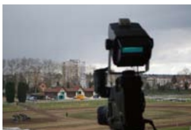
14. Au 3 ème étage, la caméra pour le controle film