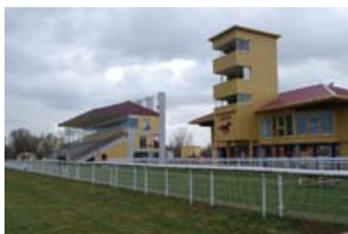
2. Les nouveaux bâtiments