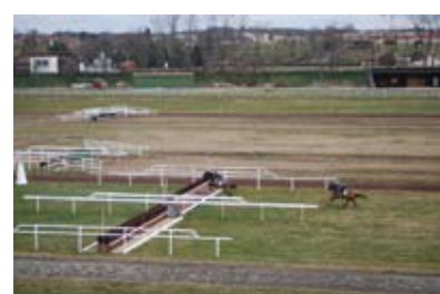
15. Test du nouveau parcours de steeple