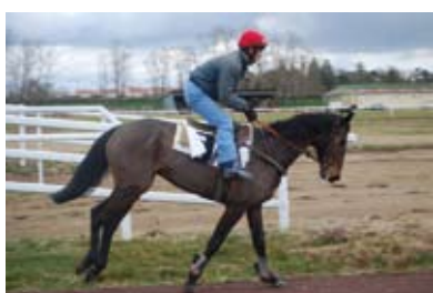
10. En route pour les haies