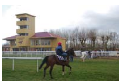
17. Les chevaux sortent de pistes